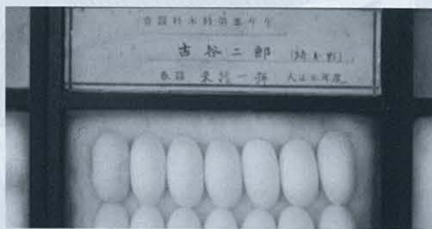
大正時代の繭標本